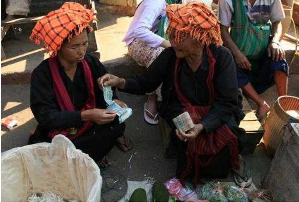
<그림 1> 빠오족

이와 같이 당시 언어의 차이에 따른 꺼잉족의 하위종족 분류는 매우 다양하고 복잡하며 이러한 꺼잉족 종족성의 느슨함으로 인해 미얀마의 인구조사통계에 따른 꺼잉족의 전체 인구 수치 역시 종족적 진위성에 대해선 논란의 여지가 있다. <표 2>에서 보는 바와 같이 1901년을 시작으로 10년마다 시행한 미얀마의 인구조사통계에 의하면 꺼잉족의 인구수는 매 해 급증하고 있음을 확인할 수 있다. 이는 영국의 식민주의가 식민정부수립 초기에 미얀마 하부 저지대의 윤택한 지역으로 산지의 꺼잉족을 이주시키는 정책을 펼쳤는데, 이 당시에 미얀마 하부지역은 미국 침례교의 선교사들이 집중적으로 선교활동을 펼친 곳이었으며, 여기에서 기독교로 개종한 많은 꺼잉족들이 이후에 식민정부의 하위직 관리로 고용되기 시작하면서 다양한 행정적 혜택의 수혜자 집단으로 떠오르자 이것이 주변의 타 종족집단들의 종족정체성의 변화에도 결정적인 영향을 미친 것으로 보인다. 또한 영국 식민정부는 행정체도나 치안유지를 위한 경찰, 군대조직에 철저히 버마족을 소외시키고 상대적으로 영국식민정부에 꺼잉족을 포함한 소수종족들을 기용하는 등의 정책을 시행하였는데 이때에도 당시에 종족정체성이 희미했던 여타 종족집단들이 식민정부의 혜택을 받는 계층이 되고자 하는 열망으로 꺼잉족으로 자신의 종족정체성을 전환한 종족들이 증가한 현상으로 해석된다. 이러한 꺼잉족 인구급증 현상은 이후에도 지속되어 1943년도 일본의 점령하에서 실시된 인구조사에 의하면 꺼잉족의 총 인구수가 약 3백만 명까지 폭증하게 된다.