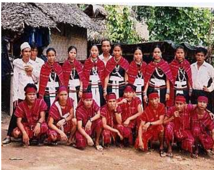
<그림 2> 껀잉니족

그러나 원래 껀잉니족은 독립 이전까지 대부분이 정령신앙도로 구성되어 있었다. 독립 이후 껀잉니족의 정체성을 부여해준 상좌부불교라는 종교적 요소는 일종의 공통된 의식(儀式)과도 같은 것이었다. 뒤르캥(Durkheim)은 신앙, 특히 의식을 개인 간의 전통적인 사회적 유대를 강화시키는 방식으로 강조하였다. 즉, 한 집단의 사회구조가 의례나 신화에 의해서 상징적으로 표현되는 것 그리고 그것이 사회적 가치관을 통해서 강화 및 유지되는 방식을 강조한다. 껀잉족의 경우에도 이