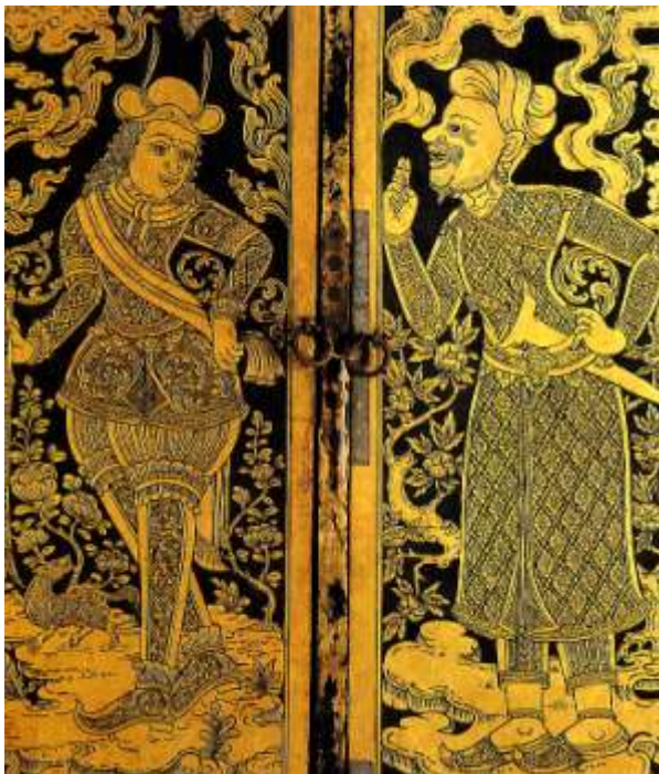
아유타야의 유럽 상인과 무슬림 상인 들이 아유타야 왕국의 인도양 무역을 담당하는

시암은 아유타야 왕조의 초기부터 인도양의 연안국들 특히 무슬림 국가들과의 무역을 중시했던 것으로 보인다. 말레이반도 서북부에 위치해 있으며 현재는 미얀마 영토에 속해 있는 떠닌따이(Tanintharyi)는 1373년에 아유타야 왕국에 의해 건설된 항구도시였다. 15세기 전반 아유타야 왕국의 상인들은 떠닌따이를 인도양 무역을 위한 주요 거점으로 삼아 페르시아만 연안까지 진출하여 무역을 했다. 시암은 남중국해와 인도양 간 가장 중요한 중계무역 항구로서 무슬림 상인들에게 있어서 동남아시아 무역의 중심지였던 몰라카(Malacca)를 15세기 초에 공격하여 자신의 통제 하에 두려고 했다. 또 시암은 1488년에 떠닌따이의 북쪽 안다만해 연안에 있는 떼웨이(Dawei)를 정복했다.